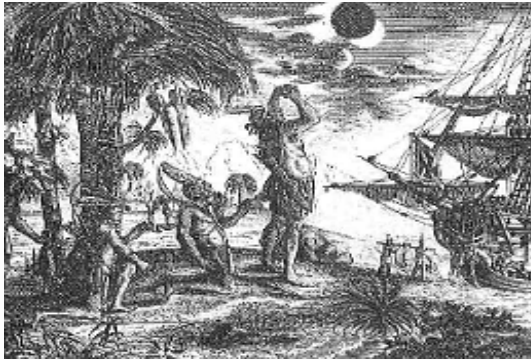
A chegada de Colombo, 1492.

4. Observe as figuras e as informações abaixo e, em seguida, atenda ao que se pede em relação à chegada dos europeus na América.